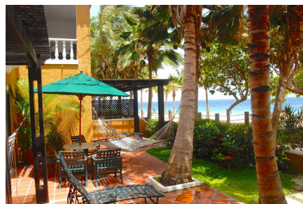
BEACHFRONT TWO BEDROOM SUITE

Diese luxuriöse Unterkunft bietet allen Komfort der Beachfront One-Bedroom Suite mit einem zusätzlichen, geräumigen Schlafzimmer mit Verbindungstür sowie Balkon. Die Two Bedroom Suite ist mit einem King-Size-Bett, Queen-Size-Sofa im Wohnzimmer und zwei Doppelbetten im zusätzlichen Schlafzimmer im Obergeschoss verfügbar. Größe: ca. 130qm; nur auf Anfrage