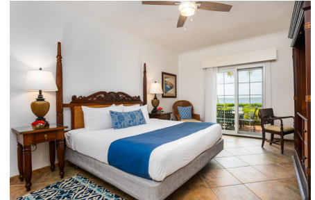
PREMIER BEACHFRONT ONE BEDROOM SUITE

Diese luxuriöse Unterkunft bietet allen Komfort der Beachfront One-Bedroom Suite mit einem zusätzlichen, geräumigen Schlafzimmer mit Verbindungstür sowie Balkon. Die Two Bedroom Suite ist mit einem King-Size-Bett, Queen-Size-Sofa im Wohnzimmer und zwei Doppelbetten im zusätzlichen Schlafzimmer im Obergeschoss verfügbar. Größe: ca. 130qm; nur auf Anfrage