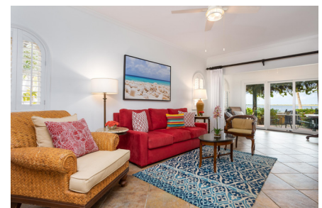
PREMIER BEACHFRONT TWO BEDROOM SUITE

Die Premier Suite verfügt über eine große private Terrasse am Strand mit Sonnenschirm, Liegestühlen und Hängematte. Der Wohnbereich der Suite ist im kolonialen Plantagen-Stil eingerichtet und hat eine Küchenzeile mit Spüle, Kühlschrank und Mikrowelle. Die Premier Suite ist nur im Erdgeschoss verfügbar mit einem Kingsize-Bett und einer Queen-Size-Schlafcouch im Wohnzimmer. Größe: ca. 120qm