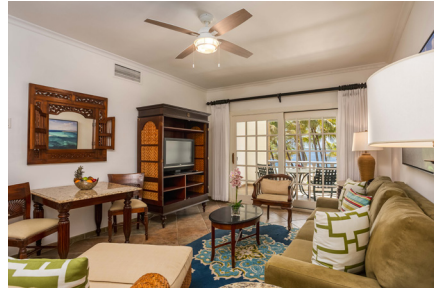
BEACHFRONT ONE BEDROOM SUITE

Die Suiten sind nur wenige Schritte vom Strand entfernt und verfügen über einen privaten Balkon mit Hängematte, Tisch und Stühlen. Der weitläufige Wohnbereich hat eine Küchenzeile mit Spüle, Kühlschrank und Mikrowelle. Das geräumige Badezimmer bietet eine Greiferfuß-Badewanne, eine Dusche aus italienischem Marmor sowie Waschbecken aus Granit mit Holzarmaturen. Nur im Obergeschoss verfügbar mit einem Kingsize-Bett und einer Queen-Size-Schlafcouch im Wohnzimmer.