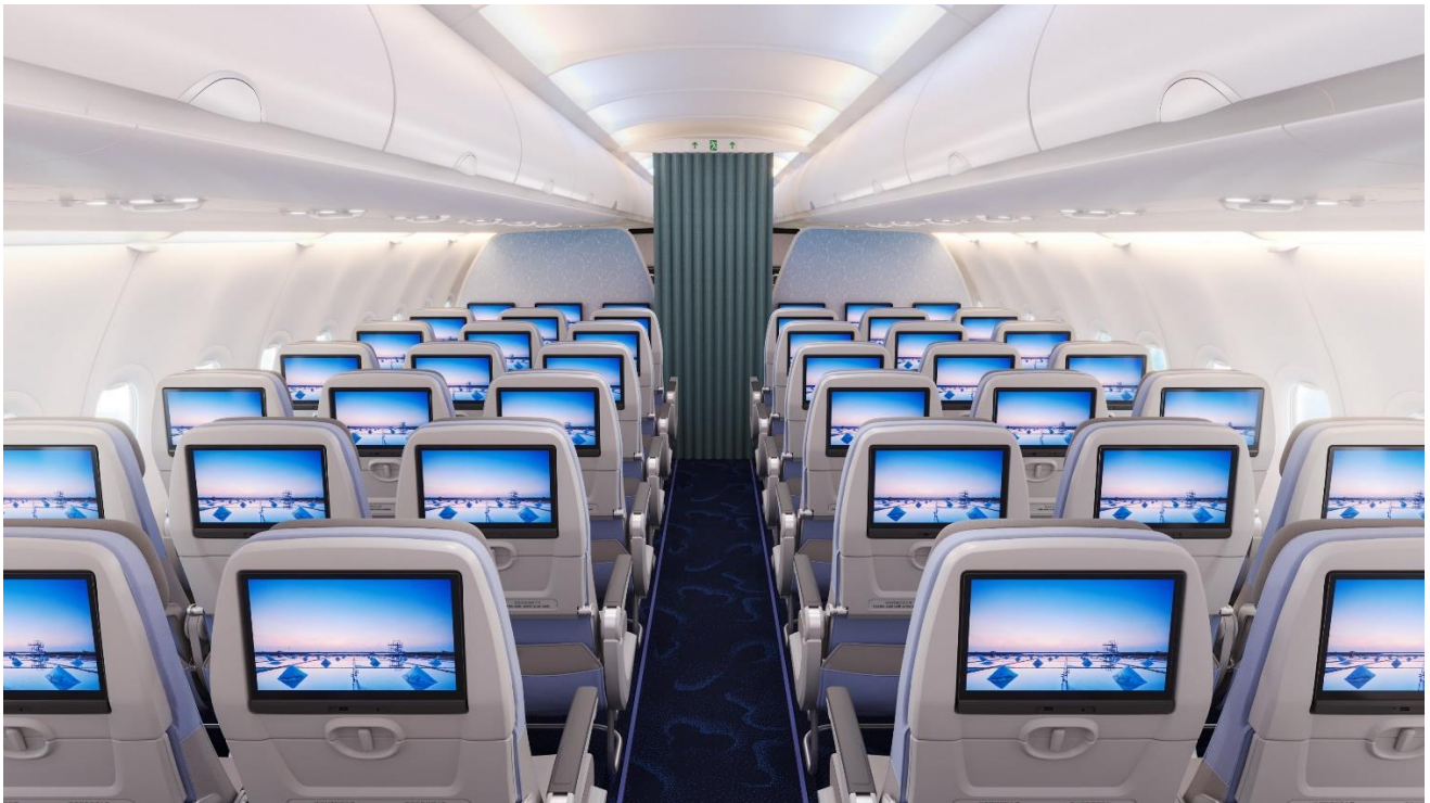
Economy Class A321neo

In der Economy Class wurden helle Farben gewählt, um ein lebendiges urbanes Ambiente zu schaffen. Sowohl die völlig flachen Business Class-Sitze als auch die geräumigen und komfortablen Economy Class-Sitze sind mit hochauflösenden 4K-Displays ausgestattet. Die großen 13,3-Zoll-Displays in der Economy Class bieten ein verbessertes Bord-Entertainment. China Airlines ist bestrebt, seinen Service kontinuierlich zu verbessern, um Reisenden das beste Flugerlebnis zu bieten.