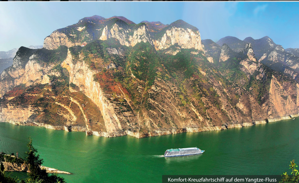
Komfort-Kreuzfahrtschiff auf dem Yangtze-Fluss