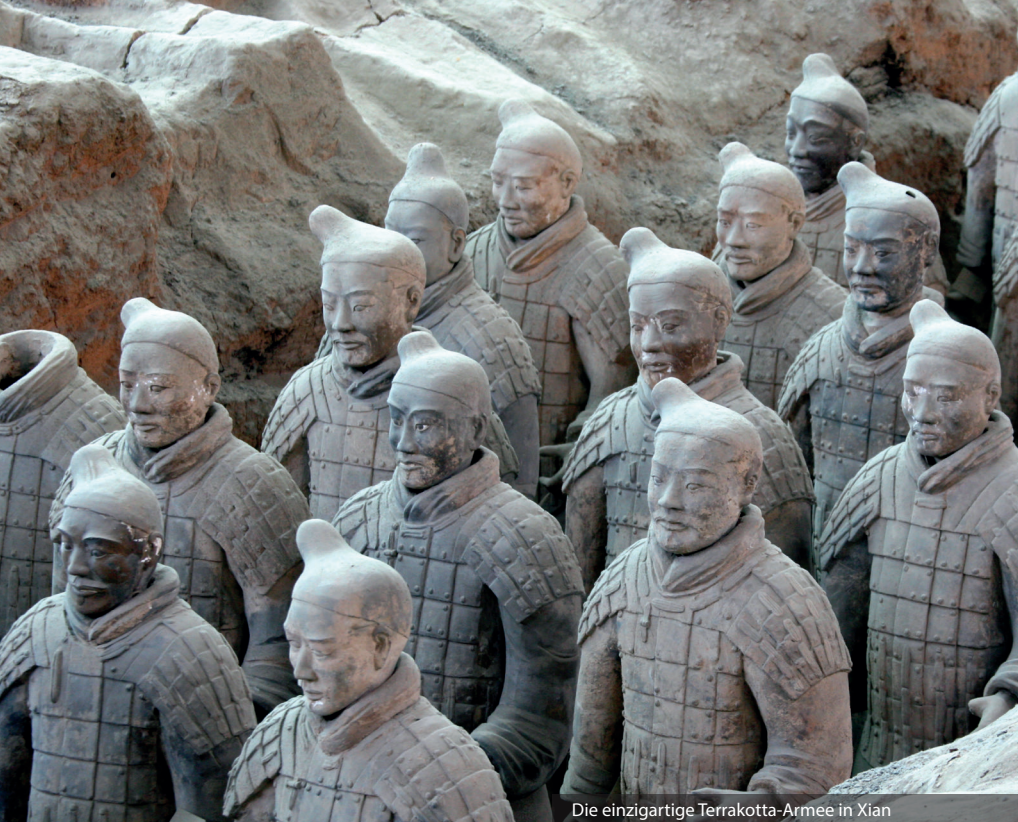
Die einzigartige Terrakotta-Armee in Xian

Diese Reise führen wir in Kooperation mit anderen Veranstaltern durch (s.S. 10).