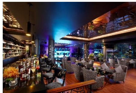
By The Pond

By The Pond lancierte eine "7 Day Non-Stop Promotion" mit verschiedenen Weinmenüs an jedem der sieben Tage der Woche. Ein täglicher Genuss für die Gäste!