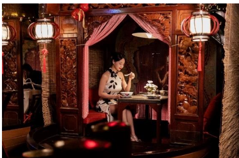
La Wan A Cantonese Kitchen

Ein Restaurant, das kantonesische, regionale Delikatessen anbietet. Erleben Sie in einer traditionell kantonesischen Atmosphäre, durch die Dekoration mit Sampans von der Lychee Bay von Xiguan eine Geschmacksexplosion. Da das chinesische Neujahr näher rückt, hat sich das Lai Wan A Cantonese Kitchen eine neue Kreation ausgedacht: den Neujahres-Glücks-Milchtee, ein Tee mit vollmundigem Duft und dick-milchigen, geschmeidigen Geschmack. Die zusätzliche Dekoration des Tees mit löwenförmigen Eiswürfeln verleiht dem Getränk einen festlichen Touch zum chinesischen Neujahrsfest